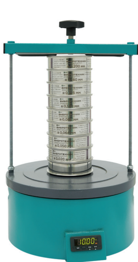
Анализатор А 12