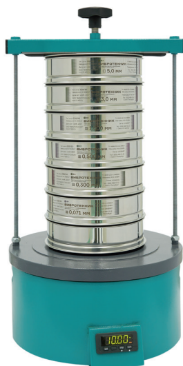
Анализатор А 20