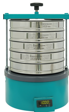
Анализатор А 30