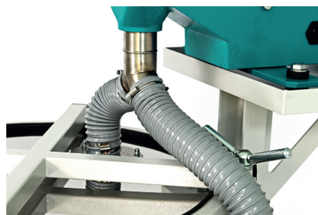
Грохот ГР 50 удвоенной производительности с одновременной загрузкой на 2 сита