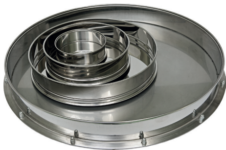
Поддоны диаметром 120, 200, 300 и 500 мм

Поддон грохота предназначен для непрерывной разгрузки в приемную емкость материала, прошедшего через нижнее сито.