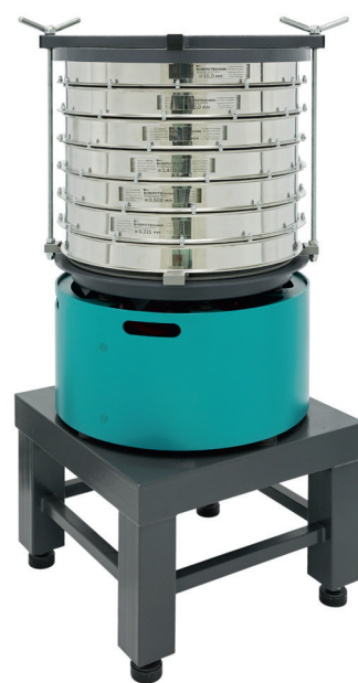
Анализатор А 50