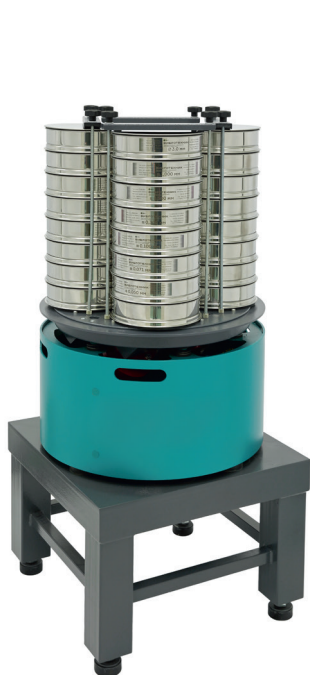
Анализатор А 20x4