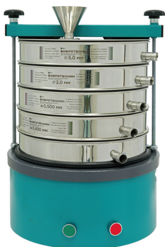
Грохот ГР 30