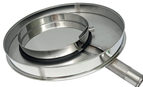
Поддоны Грохота ГР 30 и ГР 50