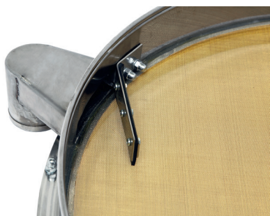
Патрубок и отбойник сита ГР 50