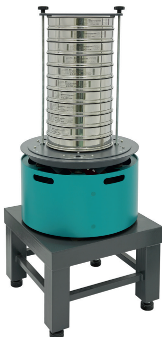
Анализатор А 30 на базе ВП 50