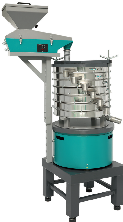
Агрегат рассеивающий с Питателем ПГ 1