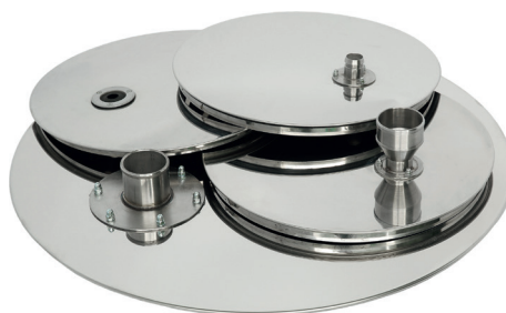
Крышки ГР 30 с патрубком и мембраной, Крышка ГР 50 с воронкой