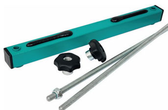
Устройство крепления сит УКС