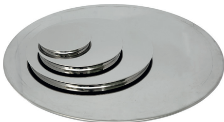
Крышки диаметром 120, 200, 300 и 500 мм